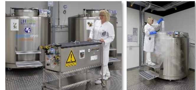
Probenlagerung in der Gasphase von flüssigem Stickstoff