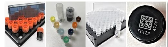
Unterschiedliche Lagergefäße mit eingelasertem 2D-Code