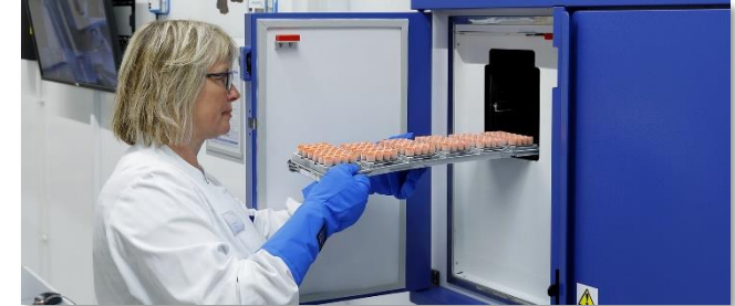
Probenlagerung bei -80°C im automatisierten Lagerroboter

Bitte kontaktieren Sie uns unter: Tel.: 0551/39-65700 E-Mail: biobank@med.uni-goettingen.de www.biobank.umg.eu